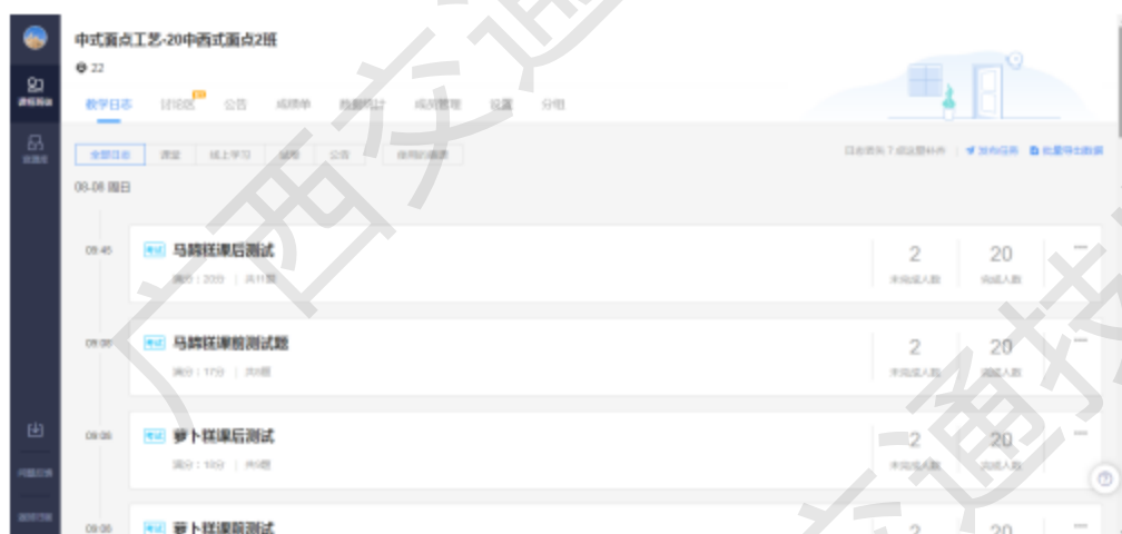
网络课堂学习资源